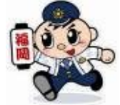
認知件数の推移(10年間)